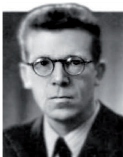
comercial títol de “Tenia Hans Asperger la síndrome d'Asperger?”.